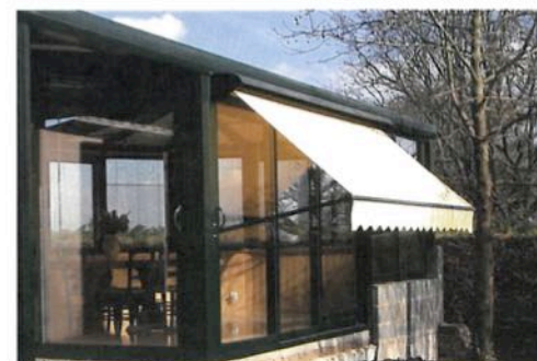
store en extérieur