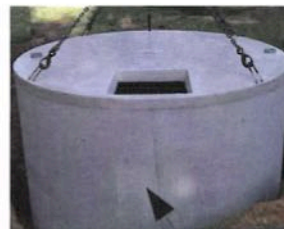
Cuve ciment, 10m 3 = 5 à 6000 €