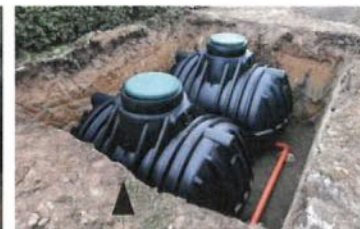
Cuve polyéthylène, 500 à 7000 €