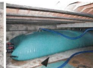
Réservoir souple pour les vide sanitaires 15 m 3 = 1000 à 1300 €